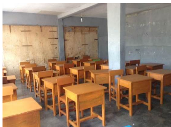
Aankoop van 20 banken en tafels.