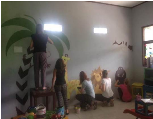
Schilderacties van onze vrijwilligers