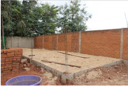
Voor en na foto informaticalokaal