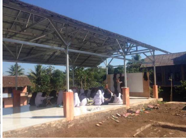
Foto's boven: van start tot afgewerkt project en al direct in gebruik – bouw van open klassen