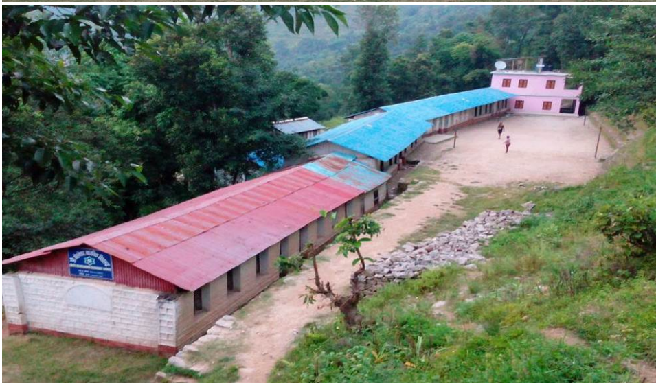
Bouworde heeft het gebouw achteraan afgewerkt (het gebouw dat in het roze is geschilderd).