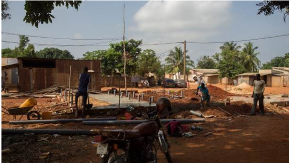
Voor en na foto sanitaire blok.